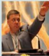
Oleh Tyahnybok Partijleider Svoboda