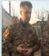
Valentyn Nalyvaichenko Voormalig hoofd geheime dienst Oekraïne

Zij zouden achter de schermen actief zijn